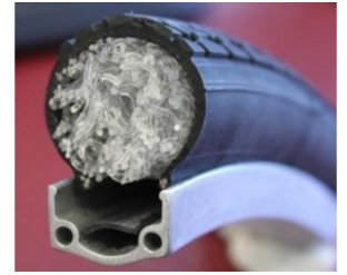
空気の代わりになる樹脂の特殊加工クッション材