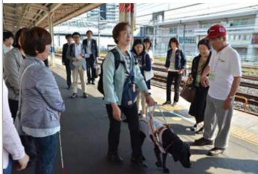
蕨市駅ホーム 声かけサポート講習会