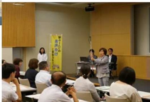
川口市駅ホーム 声かけサポート講習会