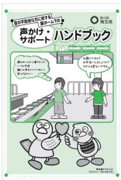
声かけサポート・ハンドブック