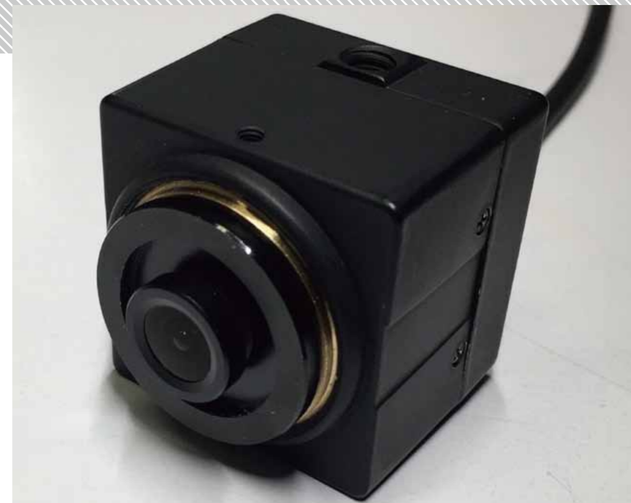
筐体組込みタイプ