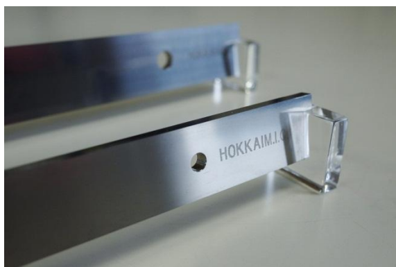
〈当社で製作したカッターサンプル〉

カッターの平面度が 1\ \mu\text{m} 以下の精度でできており、金属箔にバリを発生させない状態でカット可能。